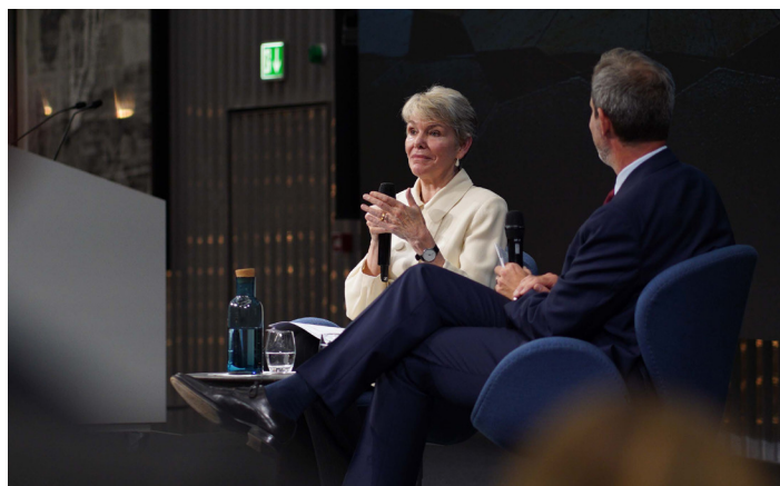
Hilary Charlesworth, juge à la Cour internationale de Justice, lors de l'ouverture de l'année académique le 25 septembre 2024.